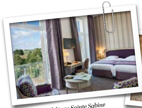
Château Sainte Sabine