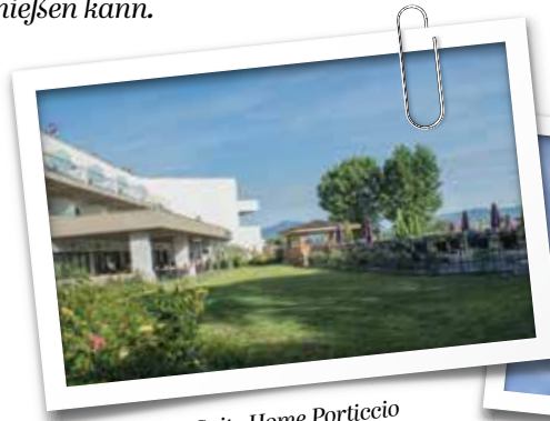
Suite Home Porticcio